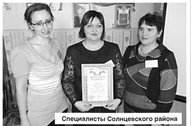
Специалисты Солнцевского района

Стало уже доброй традицией вручение переходящего кубка «Село без детской преступности» в том селе, где нет детей и подростков, состоящих на учете в КДН и ЗП, ПДН и внутришкольном контроле. Кубок уже побывал в селах Беловского, Большесолдатского, Суджанского, Обоянского районов. По итогам работы 2017 года он будет вручен в Пристенском районе.