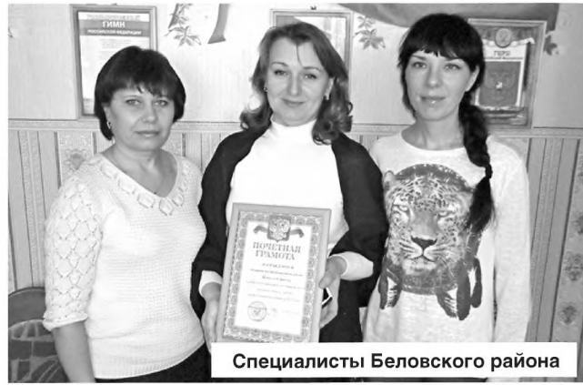
Специалисты Беловского района