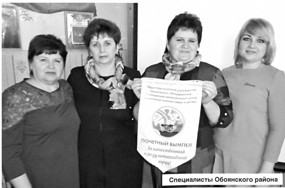
Специалисты Обоянского района