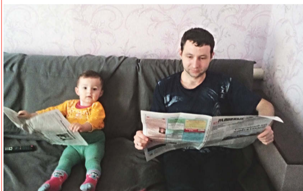
«Читаем вместе с папой»